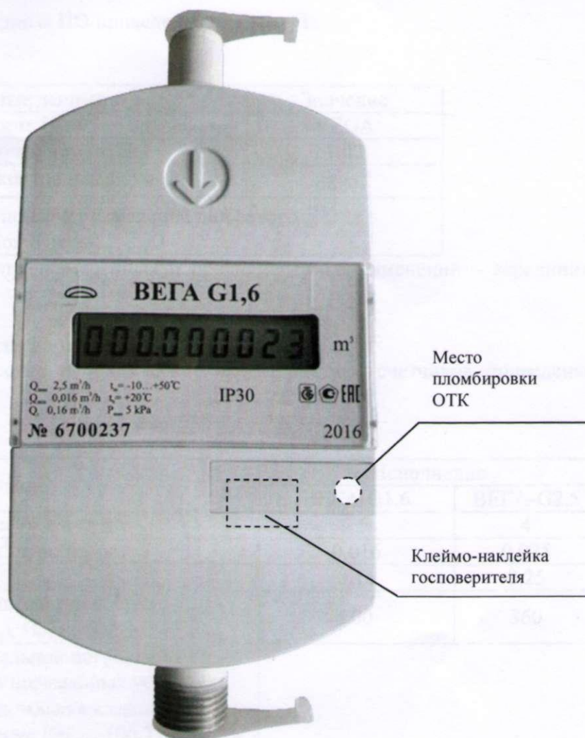
Рисунок 2 – Схема опломбирования счетчика